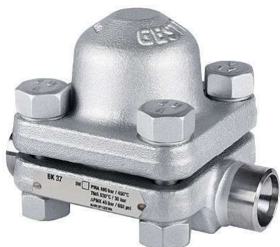
BK 37 / 28 / 29

Θερμοστατικού τύπου Διμεταλλικών ελασμάτων PN63/100 class600 Κολλητά / φλαντζωτά άκρα