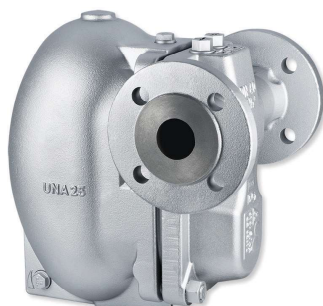
UNA 25 PS

ΛΕΙΤΟΥΡΓΙΑ: Η αυτόματη αντλία πλωτήρος εξασφαλίζει πως το συμπύκνωμα μπορεί πάντα να επιστρέψει ανεξαρτήτως της ζήτησης. Το συμπύκνωμα αντλείται έξω από το σώμα του εξοπλισμού με την χρήση - βοήθεια ατμού υψηλής πίεσης (booster steam)